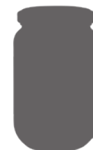
Bocal 37 cl 37 cl Jar