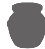
Pot Orsio Orsio jar