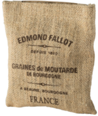
Graines de Moutarde de Bourgogne Mustard Seeds from Burgundy Sac de toile de jute 250g Jute Bag 250g