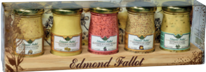
Présentoir Bois 5 Bocaux 10cl 520g Gift Crate 5x10cl Jars