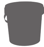
Seau Baby Plastique Plastic Baby Pail