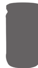
Bocal 72 cl 72 cl Jar