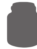
Pot Grès 250g 250g Stoneware Jar