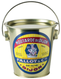
Moutarde de Dijon Seau Baby Fer 450g Baby Metal Pail 450g