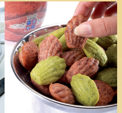
ET AUTRES INVENTIONS... AND OTHER CREATIONS