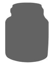
Pot Grès 500g 500g Stoneware Jar