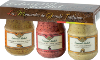
Lot 3 bocaux 10cl Tray of 3x10cl Jars