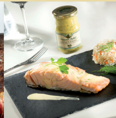
VIANDES ET POISSONS MEAT AND FISH DISHES