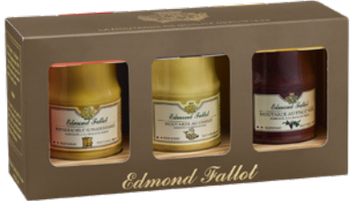
Trio "Gourmand" 10cl 310g Trio « Gourmand » 310g