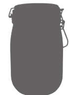
Bocal Pratique 1/1 Pratique 1/1 jar